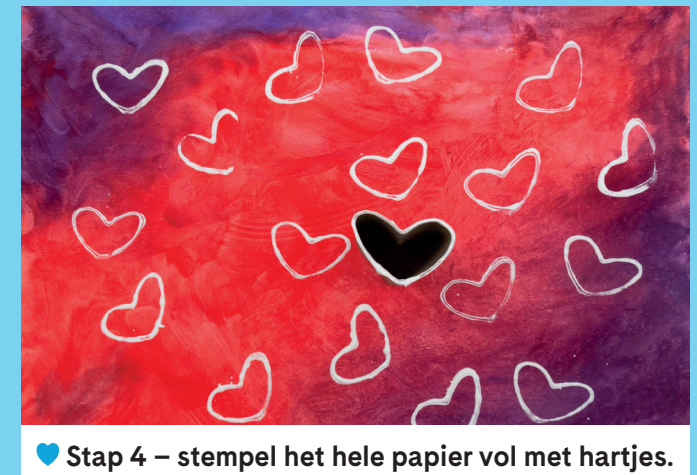
♥ Stap 4 – stempel het hele papier vol met hartjes.