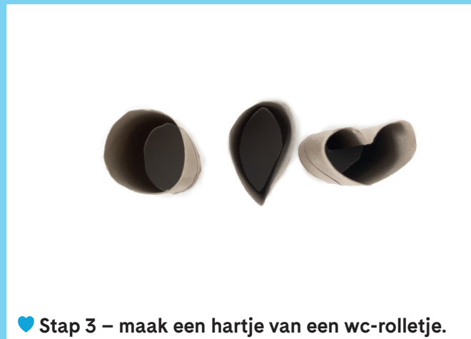
♥ Stap 3 – maak een hartje van een wc-rolletje.