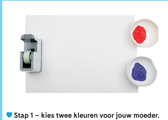
♥ Stap 1 – kies twee kleuren voor jouw moeder.