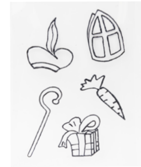
♥ Stap 2 - Teken de lijnen van de Sinterklaastekeningen over.