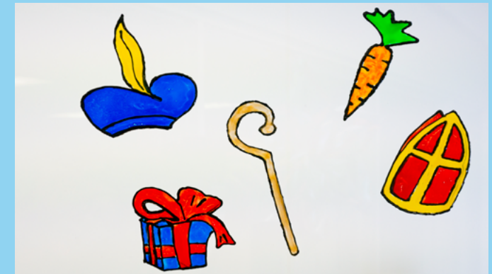
♥ Stap 4 -Haal de stickers van de sheet als ze goed droog zijn.