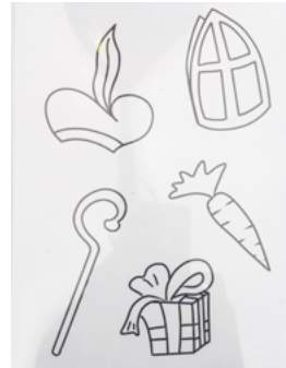
♥ Stap 1 - Leg de transparante sheet op de Sinterklaastekeningen en plak vast met plakband.