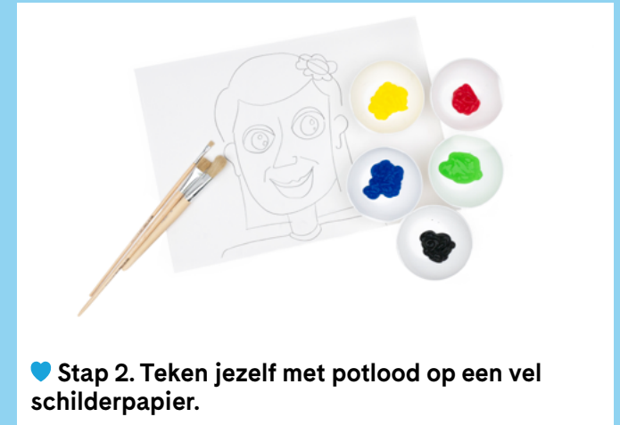
♥ Stap 2. Teken jezelf met potlood op een vel schilderpapier.