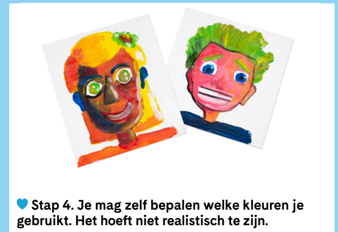
♥ Stap 4. Je mag zelf bepalen welke kleuren je gebruikt. Het hoeft niet realistisch te zijn.