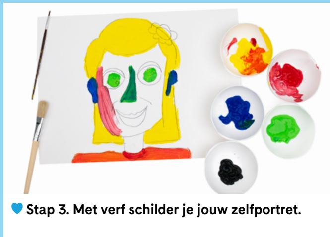
♥ Stap 3. Met verf schilder je jouw zelfportret.