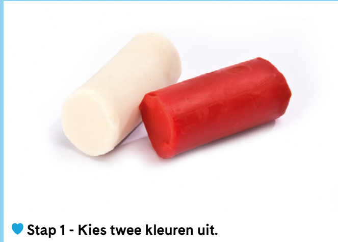
♥ Stap 1 - Kies twee kleuren uit.

TIP! Je kunt ook proberen om de zuurstok met meer dan 2 slierten te maken. Het wordt dan iets uitdagender om de slierten om elkaar heen te draaien.