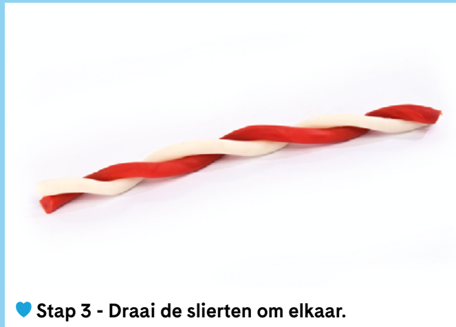
♥ Stap 3 - Draai de slierten om elkaar.