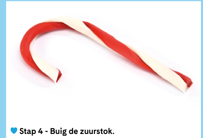
♥ Stap 4 - Buig de zuurstok.