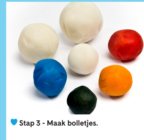
♥ Stap 3 - Maak bolletjes.