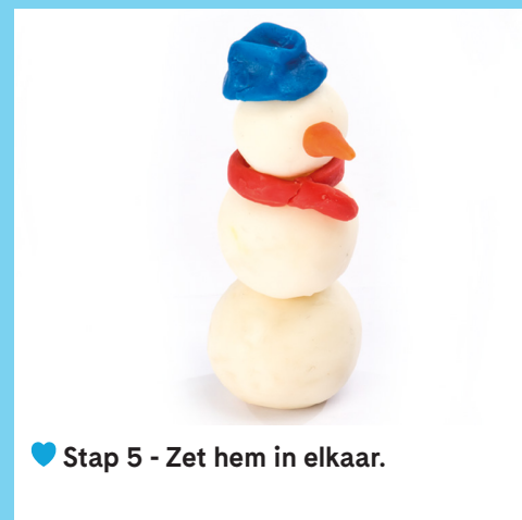
♥ Stap 5 - Zet hem in elkaar.