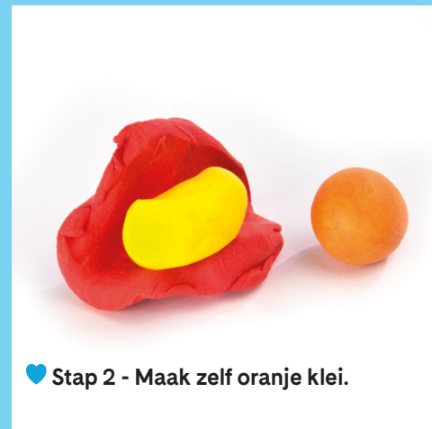
♥ Stap 2 - Maak zelf oranje klei.