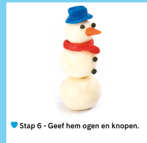
♥ Stap 6 - Geef hem ogen en knopen.