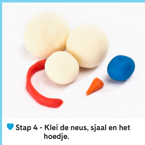
♥ Stap 4 - Klei de neus, sjaal en het hoedje.