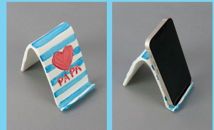
♥ Stap 4 – schilder het in mooie kleuren.