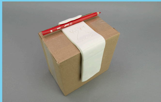
♥ Stap 3 – laat de klei drogen op een doos.