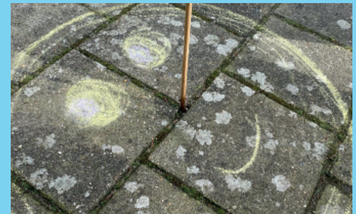
♥ Stap 4 - Tadaaa!