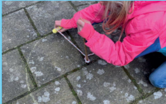
♥ Stap 1 - Maak het krijtje vast aan het stokje

Klei jouw eigen creatie, laat deze zo'n 24 uur drogen aan de lucht en dan de volgende dag lekker naar buiten om aan de slag te gaan met jouw eigen gemaakte kleurige krijtjes.