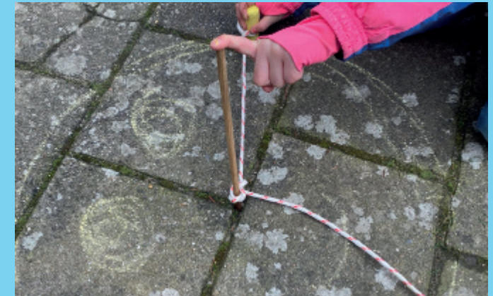
♥ Stap 2 - Hou de stok en het krijtje goed vast