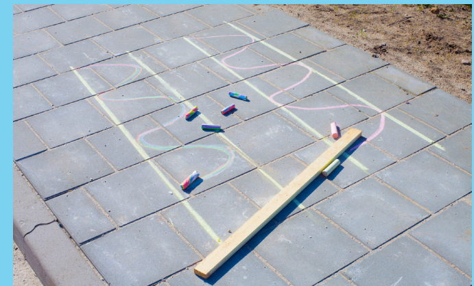
♥ Stap 4 - Teken deze patronen tussen 2 lijnen na