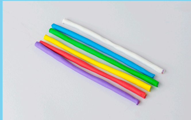
♥ Stap 1 - Kies jouw kleuren stoepkrijt klei

Klei jouw eigen creatie, laat deze zo'n 24 uur drogen aan de lucht en dan de volgende dag lekker naar buiten om aan de slag te gaan met jouw eigen gemaakte kleurige krijtjes.