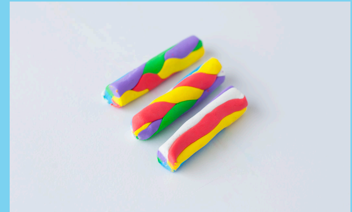
♥ Stap 2 - Maak jouw fantasie krijtje